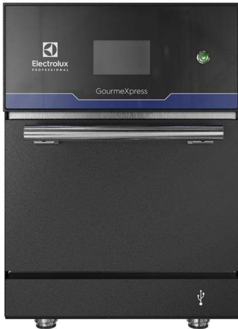
603952 (EPRPROBTD) GourmeXpress Hochgeschwindigkeits-Ofen mit zwei Magnetronen 380-415V/3N/50Hz